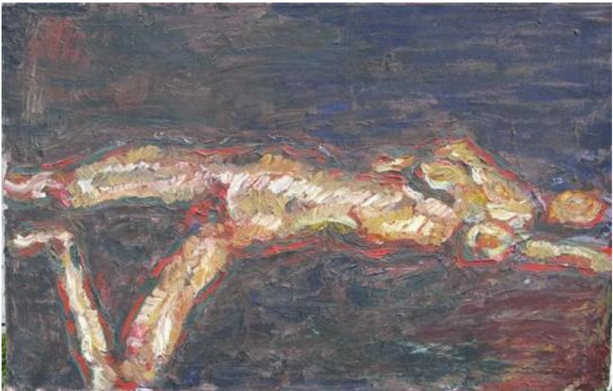
Olie på lærred. Titel: Januar 1978