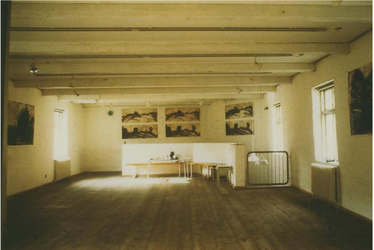
Herunder følger nogle eksempler på tidlige malerier.