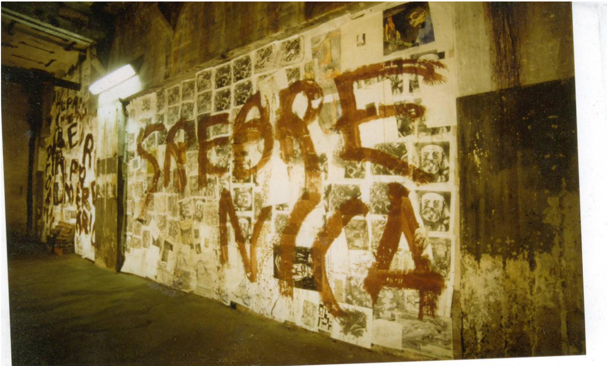
Srebrenica installationen fra 1996